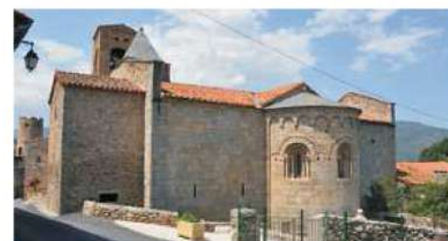
Cornellà del Conflent

Preu per persona hab. doble: 480 €uros * Socis Auga: 460 €uros Supl. Hab Individual: 90 €uros