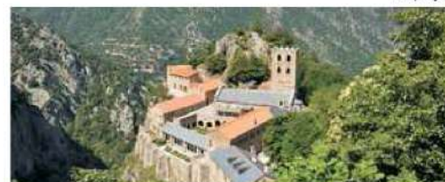
Sant Martí del Canigó