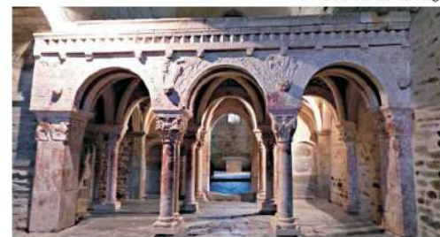
priorat de Serrabona

Viatge de retorn cap a Igualada per Montlluís i Puigcerdà. Fi del viatge i dels nostres serveis.