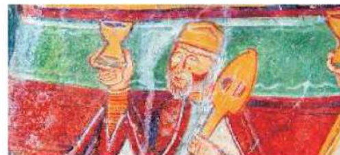
Sant Martí de Fenollar